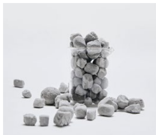
Granulats de béton écologique Néolithe.

Nos souscripteurs auront accès de manière privilégiée à l'ensemble du deal flow qualifié et pourront choisir d'accompagner, voire de financer certaines de ces sociétés, que Polytechnique Ventures en soit ou non actionnaire.