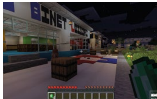
Le Bataclan, reconstitué dans Minecraft