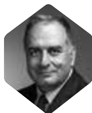
MARWAN LAHOUD (83) président de l'AX