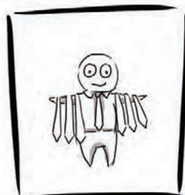
COMME KÉVIN CRAVATE