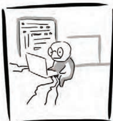
COMME PIERRE COFFRE FORT NUMÉRIQUE