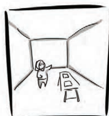
COMME URANIE DESIGN D'INTÉRIEUR

Extraits du logo de l'Institut de l'Engagement