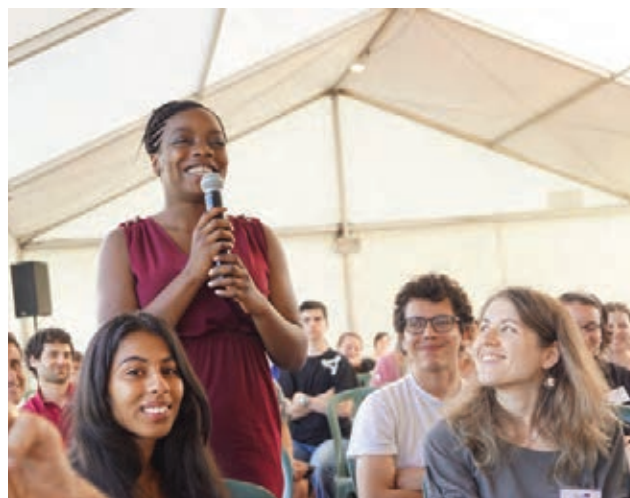
↑ Photo inter-promotions à l'occasion d'une Université de l'Engagement, à Paris.