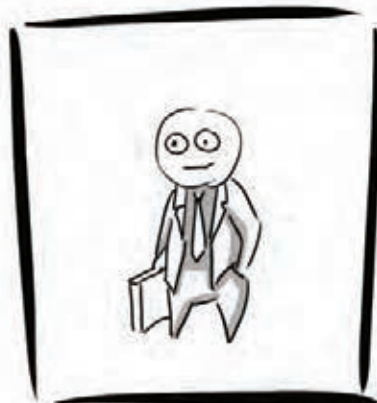
COMME YELIN SCIENCES PO PARIS