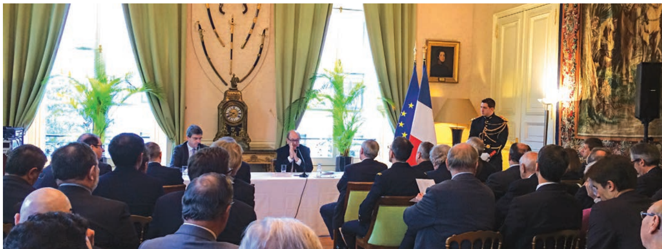
Jean-Yves Le Drian s'exprimant dans le salon Rochambeau de l'hôtel de Brienne.

L E 18 AVRIL DERNIER, nous étions près d'une centaine autour de Jean-Yves Le Drian, ministre de tutelle de l'X et invité de l'AX dans le cadre d'un petit-déjeuner polytechnicien exceptionnel. Certainement, nous aurions pu être encore beaucoup plus nombreux si nous n'avions pas été limités par la capacité du salon Rochambeau de l'hôtel de Brienne où le ministre a bien voulu nous convier pour se livrer à cet exercice inhabituel en période de réserve. Monsieur Le Drian a dressé un bilan, factuel, des cinq années de son mandat, a ouvert des perspectives pour la défense et a répondu avec beaucoup de conviction aux questions.