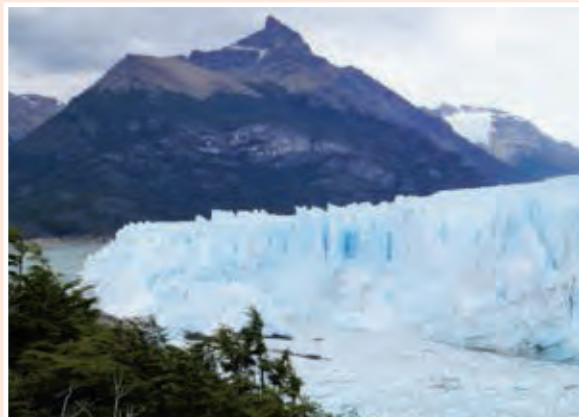
Le glacier Perito Moreno, Patagonie.