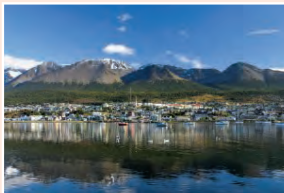
Ushuaïa, la ville du bout du monde.