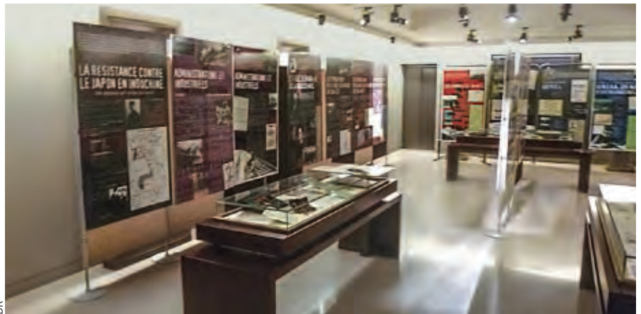
Exposition au musée de la Légion d'honneur.

X-Résistance a pour mission de recueillir, de conserver et de transmettre la mémoire des polytechniciens résistants, de rappeler et au besoin de défendre les valeurs de la Résistance et de contribuer à l'histoire de la Deuxième Guerre mondiale comme à celle de l'École polytechnique.