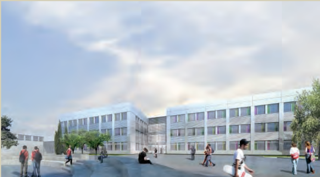
Université de Grenoble.

collectivités territoriales qui sont aujourd'hui plutôt demandeuses de ces PPP. En outre, ces projets ne dépassent généralement pas les 100 millions d'euros, ce qui correspond à notre cible de business.