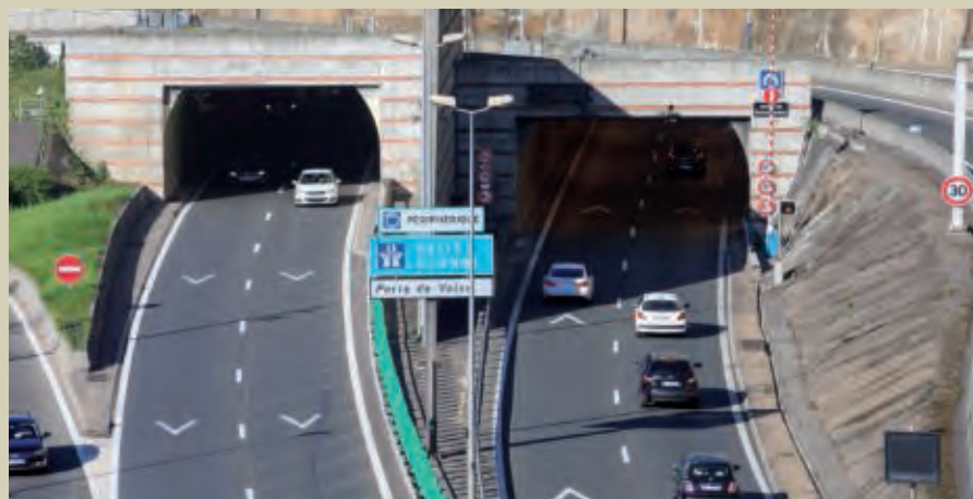
Boulevard périphérique Nord de Lyon.

Ce type d'opération constitue un défi particulièrement intéressant pour tous les jeunes qui souhaiteraient pouvoir s'impliquer dans des montages d'opérations et des projets complexes aussi bien en France qu'à l'étranger. Il y a encore beaucoup à faire et les perspectives d'opportunités sont très grandes dans ces métiers. ■