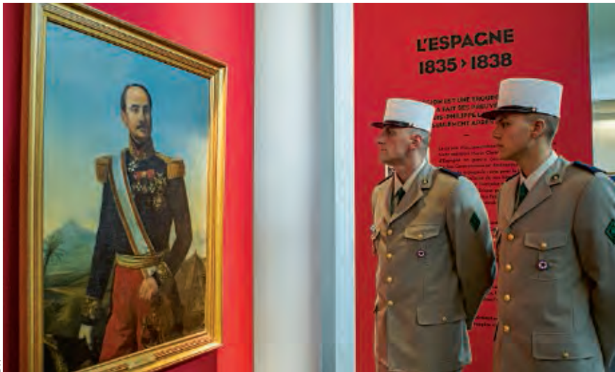
DR Deux jeunes légionnaires visitent le musée de la Légion (refait et inauguré en 2013). Le tableau représente le général Bernelle qui commanda la Légion étrangère. C'est lui qui décida de l'amalgame (mélange des nationalités au sein des unités).