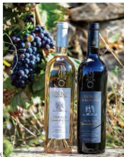
La Légion produit plus de 200 000 bouteilles par an. Ce vin s'appelle « Esprit de corps ».

Nous parlons beaucoup de fidélité. Celle-ci s'exprime également à l'égard des anciens. Il s'agit alors de solidarité au quotidien. Certains anciens rebondissent dans la vie, parfois de façon admirable. D'autres