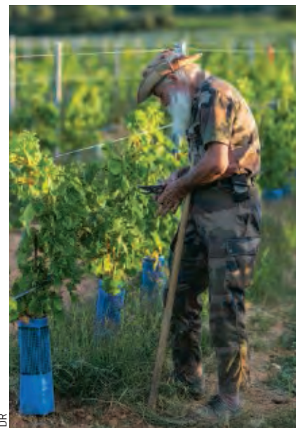
Parmi les occupations proposées aux anciens, on trouve la culture des vignes.

La pédagogie de la Légion étrangère pousse à l'extrême le processus de construction de l'esprit de corps, accueillant des hommes en déséquilibre, préoccupés par un rebond individuel. Elle leur offre de se transcender et d'adhérer à un esprit d'équipe, à un esprit de famille et à ses valeurs. Ils sont venus pour eux, et ils restent pour la Légion.