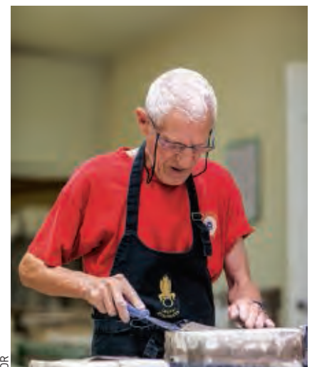
DR La fidélité s'exprime également à l'égard des anciens.

Légion étrangère se résume en sept articles qui logent sur un document au format d'une carte de crédit. C'est la première leçon de français. Et avant de recevoir leur képi, les engagés volontaires le récitent par cœur. Tout cela se vit. Il y a un esprit commun, « l'esprit de Camerone 1 », ainsi qu'une histoire commune. Tout récemment, alors qu'il n'y a plus d'argent, la Légion étrangère a reconstruit son musée à Aubagne. Deux millions d'euros ont été collectés pour construire ce bâtiment sur un terrain militaire. Aujourd'hui, ce musée est « le Louvre du légionnaire ». C'est un superbe musée. Lorsqu'il s'engage, le légionnaire le visite. Et lorsqu'il quitte la Légion, il y revient et trouve les pages d'histoire qu'il a vécues.