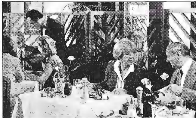
Restaurant aux Hespérides des Ternes.

Les Résidences-Services Hespérides constituent l'une des rares solutions aux problèmes de notre temps. Pour vivre avec plus de confort. Plus de services. Plus de sécurité. Sans ostentation.