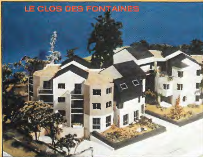
LE CLOS DES FONTAINES