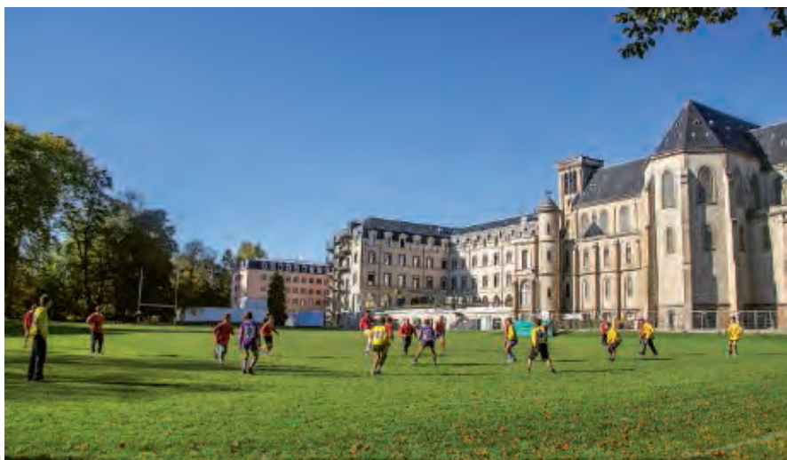
Ginette veille à favoriser le développement personnel.