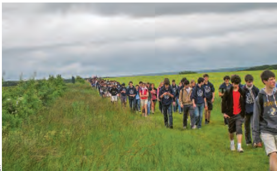
L'aumônerie organise chaque année un pèlerinage à Chartres.

Dans chaque classe, un élève est chargé d'organiser des activités culturelles, par exemple des sorties dans les musées, au concert, au théâtre. Un événement est organisé chaque mois à l'École : conférences et concerts. Un concours d'éloquence annuel mobilise les élèves et les professeurs qui sont membres des jurys. Pour permettre aux élèves de préserver une heure de liberté pour des activités personnelles, en particulier le sport qui tient une grande place, ils déjeunent tous en même temps en vingt minutes (pas de self où il faudrait faire la queue).