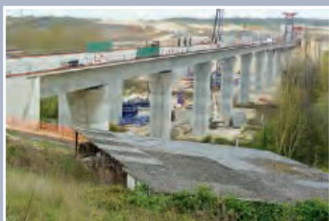
L'un des viaducs de l'Auxance.