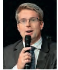
senior vice-président, Estin & Co

Aujourd'hui plus que jamais, le succès d'une stratégie dépend fondamentalement de sa vitesse et de son ampleur, plus que de la définition de la direction. Car le facteur vitesse est déterminant en matière de compétitivité. Le choix d'une vitesse de développement et d'investissement devient donc un élément clé de la stratégie.