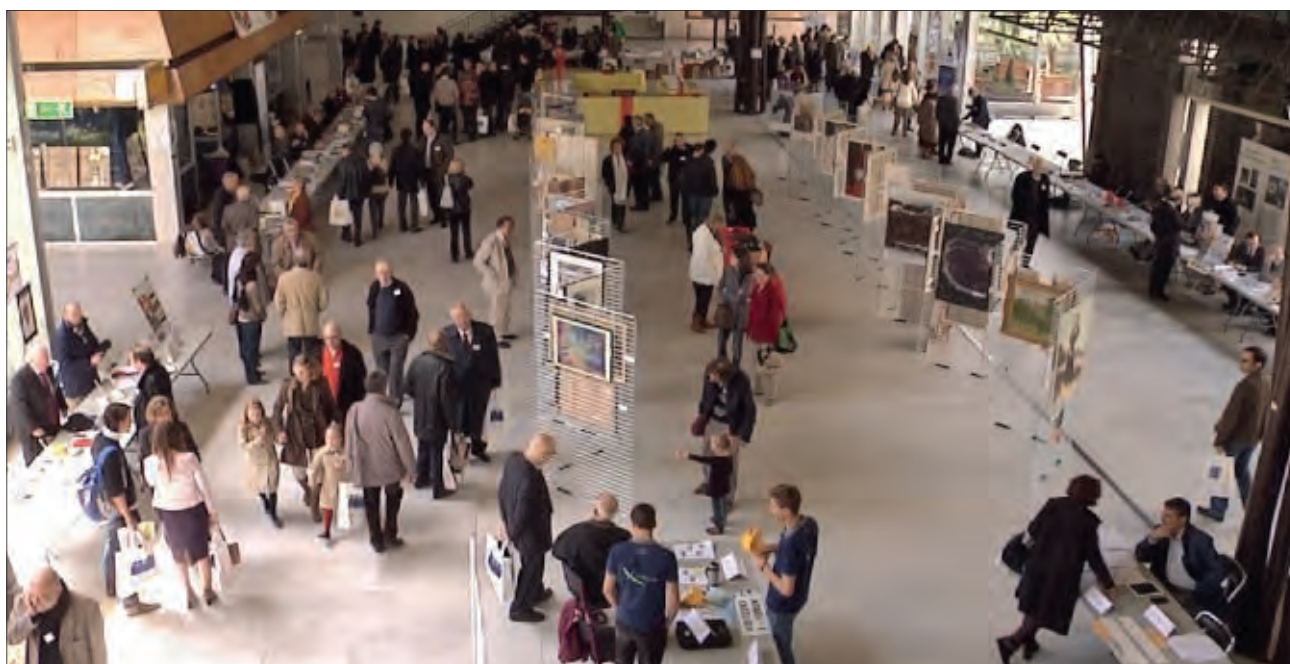
Vue d'ensemble du Grand Hall le samedi.

Il est apparu en définitive qu'organiser la fête un samedi sur le Platât pour le magnan décennal, et le lendemain sur la Montagne ou à la Maison des X rue de Poitiers pour les autres polytechniciens et leurs amis semble être un format adapté. Ce format devrait être reconduit en mai 2014.