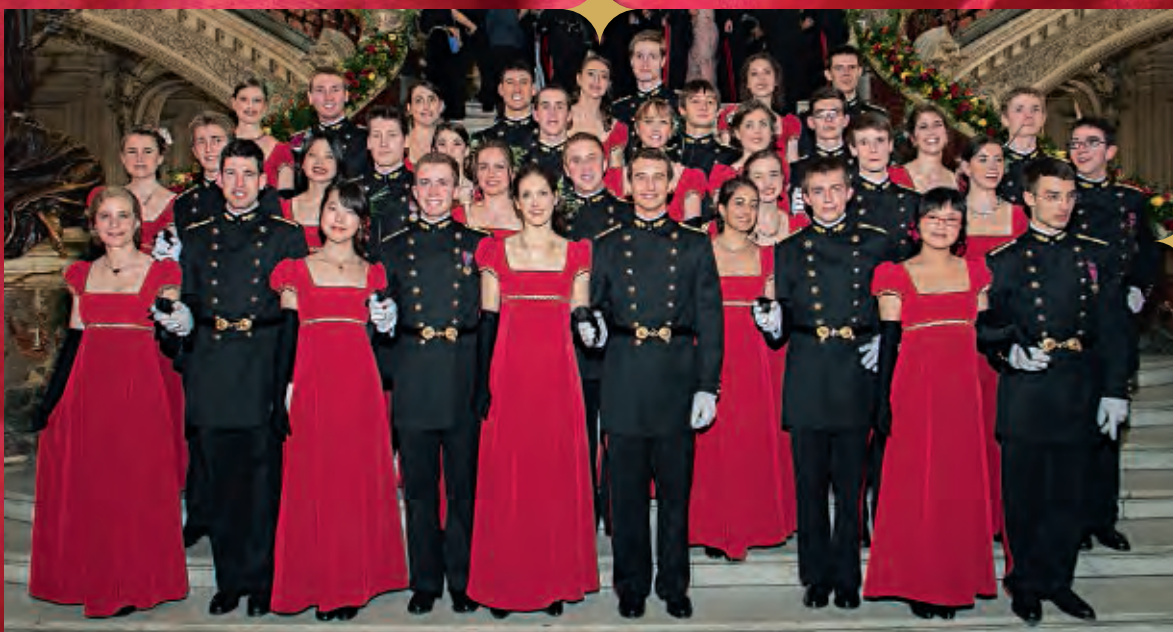
Les élèves du Quadrille du 122 e Bal de l'X.