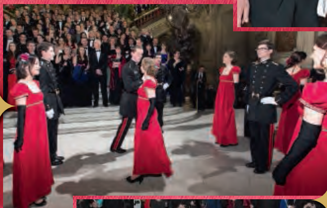
Présentation du Quadrille.