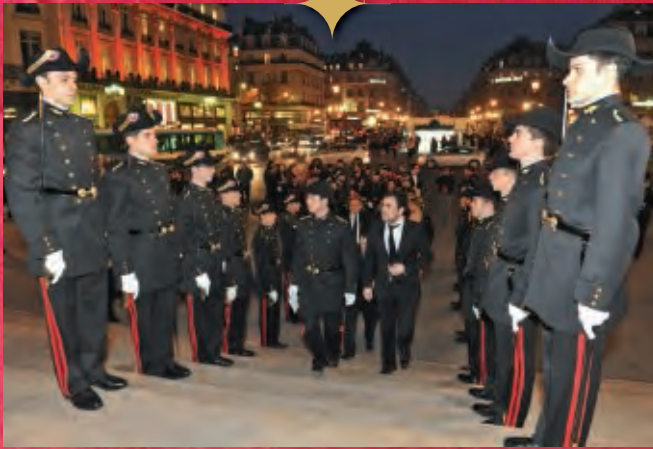
Haie d'honneur devant l'Opéra Garnier.