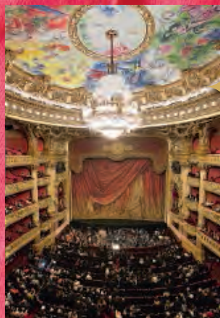
Grande salle de l'Opéra.