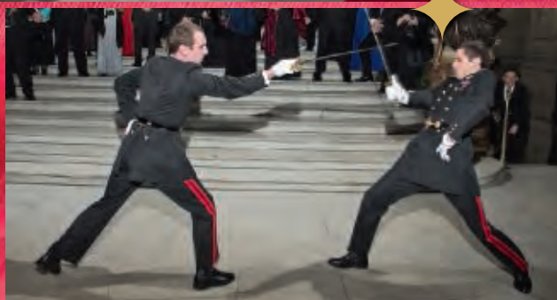
Démonstration d'escrime artistique par les élèves.