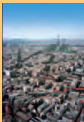
Paris mégapole.

La Jaune et la Rouge , revue mensuelle de la Société amicale des anciens élèves de l'École polytechnique