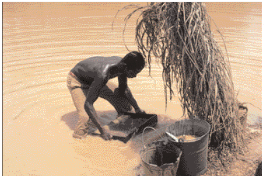
Lavage artisanal de gravier diamantifère.

Comme De Beers, d'autres sociétés ont effectivement cessé d'acheter des diamants, dans les pays en conflit,