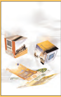
Capital-risque, capital risqué!

La Jaune et la Rouge, revue mensuelle de la Société amicale des anciens élèves de l'École polytechnique