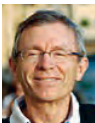
PAR JEAN-RENÉ ARGOUARC'H (70)