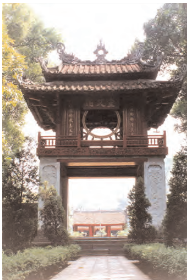
Khue Van Cac (Pavillon de la Constellation de Littérature) à Van Mieu (Temple de Littérature) – Quoc Tu Giam, la première "université" au Vietnam, fut construit en 1070.

Le vietnamien dispose d'un double lexique : par exemple aux mots purement vietnamiens que sont lời (parole), miệng (bouche) ou trời (ciel) correspondent les mots sino-vietnamiens suivants : thoại 話, khẩu 口 et thiên 天. Des néologismes ont été obtenus par la combinaison des deux lexiques. Les mots hiện 現 et nay 在 signifiant tous deux "présent" forment hiện nay, "à présent". De même giấy tờ (papier) et chủ nghĩa (主義, doctrine) produisent giấy tờ chủ nghĩa, bureaucratie.