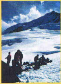
Ascension en Cordillère royale.

Revue mensuelle de la Société amicale des anciens élèves de l'école polytechnique 5, rue Descartes, 75005 Paris Tél. : 01.46.33.74.25 Mél : ax@wanadoo.fr