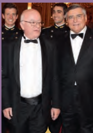
Haie d'honneur des polytechniciens des promotions 2009 et 2010 à l'entrée de l'Opéra de Paris