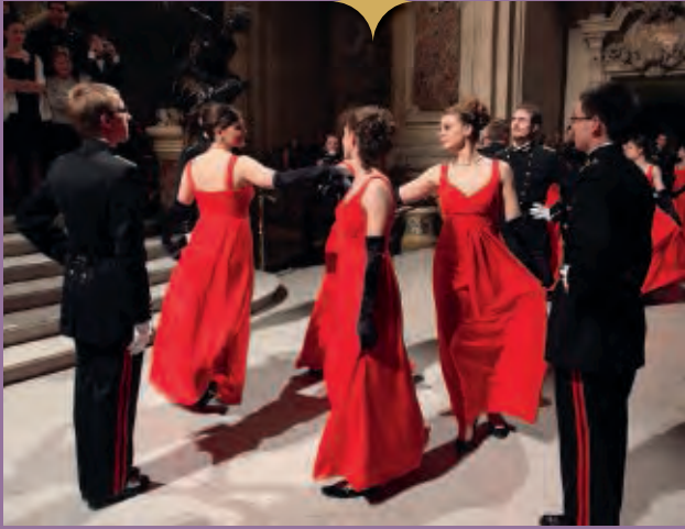
Quadrille dansé par les élèves des promotions 2009 et 2010.