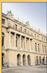
Château de Versailles.

Vue extérieure de la galerie des Glaces où fut signé le 28 juin 1919 le traité de paix avec l'Allemagne.