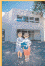
Groupe scolaire à L'Haÿ-les-Roses.

La Jaune et la Rouge , revue mensuelle de la Société amicale des anciens élèves de l'École polytechnique