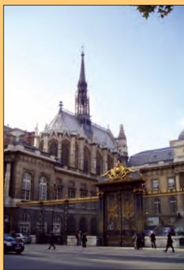
La Sainte-Chapelle et le Palais de justice.

La Jaune et la Rouge , revue mensuelle de la Société amicale des anciens élèves de l'École polytechnique