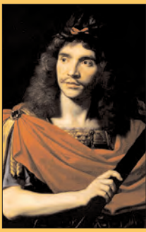
Molière par Mignard Comédie-Française (cf. page 42).

La Jaune et la Rouge, revue mensuelle de la Société amicale des anciens élèves de l'École polytechnique