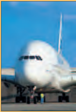
A380 de face.

La Jaune et la Rouge , revue mensuelle de la Société amicale des anciens élèves de l'École polytechnique