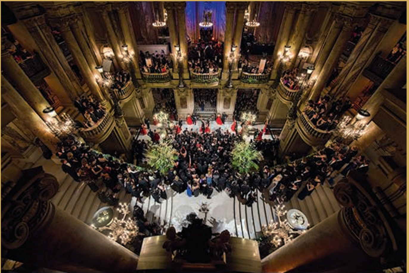
Présentation du Quadrille au pied du Grand Escalier.