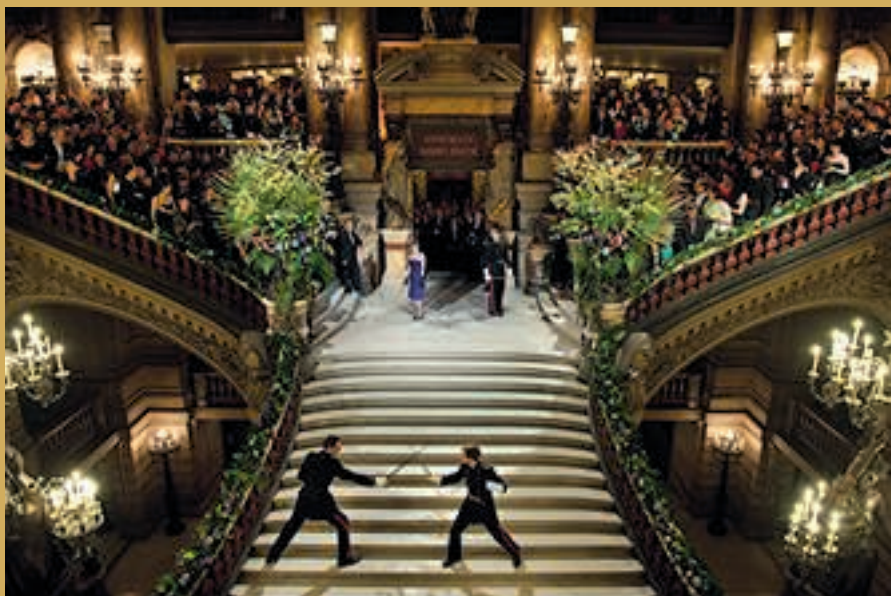
Démonstration d'escrime artistique par les élèves.