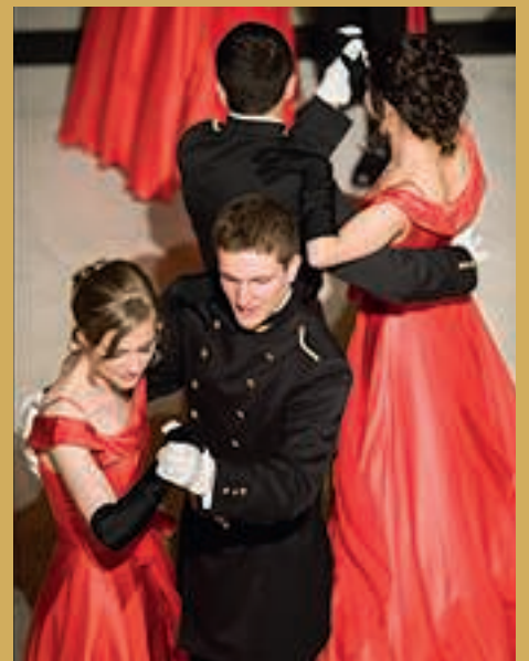
Élèves du Quadrille.