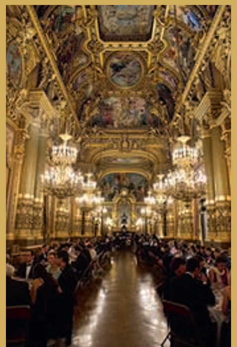
Dîner de gala dans le Grand Foyer.