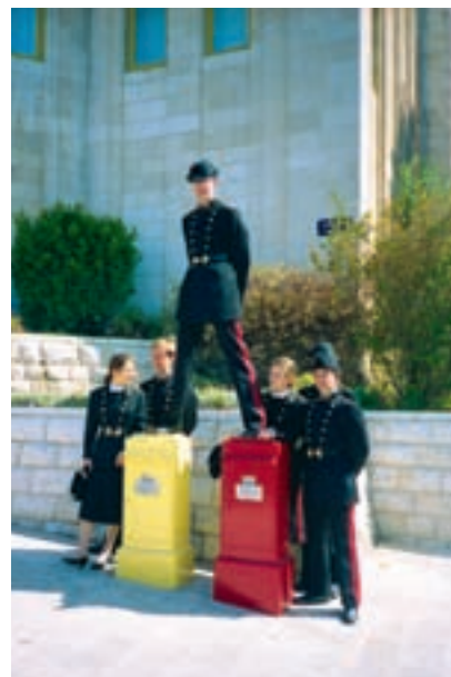
Boîtes aux lettres à Jérusalem.